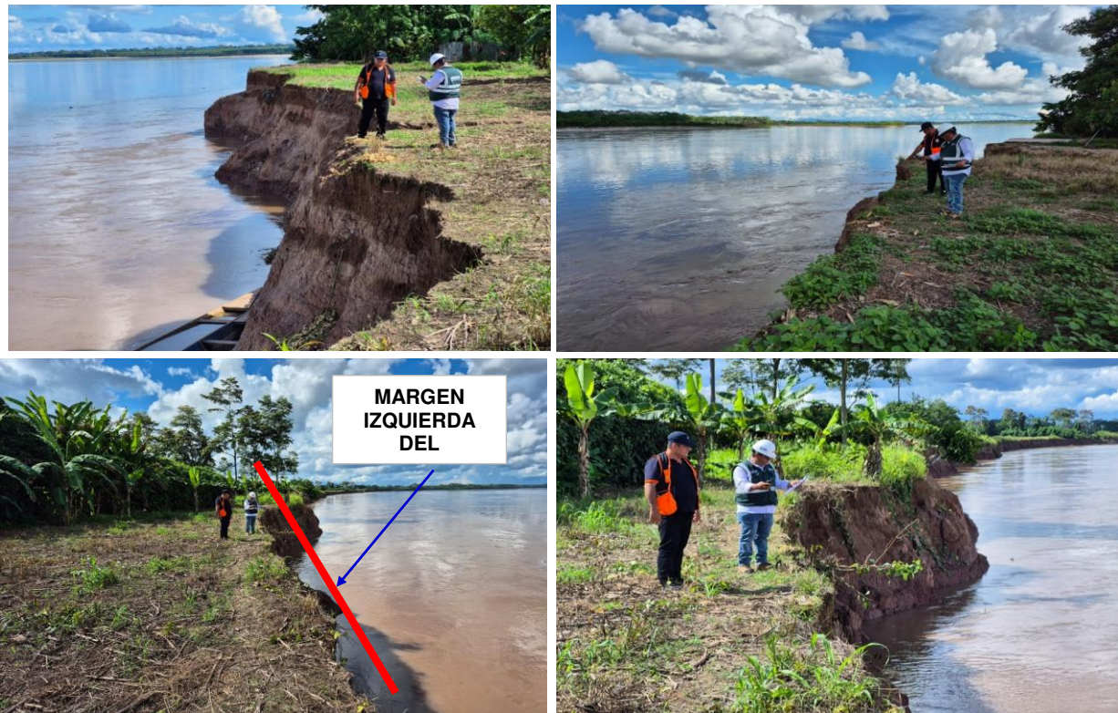
FIGURA N° 01: TRAMO CRÍTICO EN UN TRAMO DE LA MARGEN IZQUIERDA DEL RIO PACHITEA, SECTOR DEL CASERIO NUEVA UNION, DISTRITO DE HONORIA, PROVINCIA DE PUERTO INCA, DEPARTAMENTO DE HUANUCO.