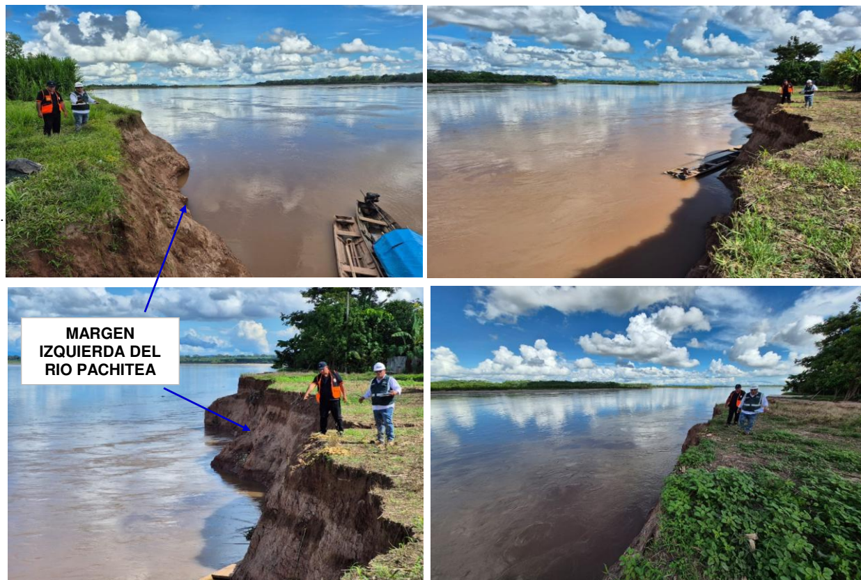
FIGURA N°03: EN LA TEMPORADA DE MAXIMAS AVENIDAS, EN UN TRAMO DEL RIO PACHITEA EROSIONA EN LA MARGEN IZQUIERDA DEL CERCADO AL CASERIO NUEVA UNION.