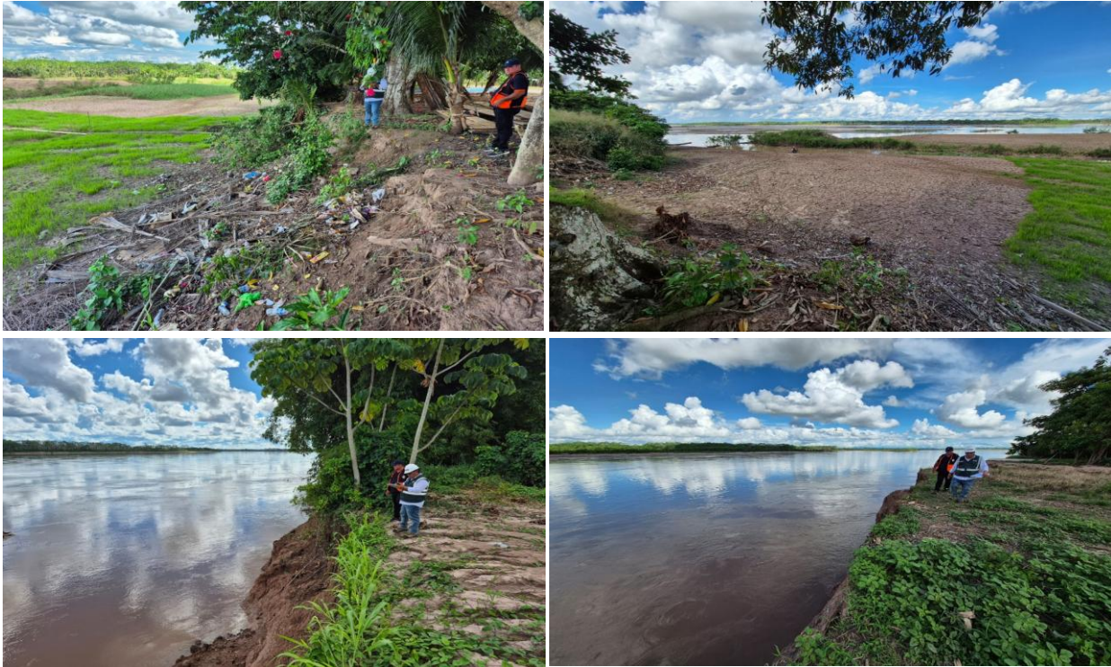
FIGURA N° 02: RIO PACHITEA EXPUESTO ANTE UN DESBORDAMIENTO EN EL CERCADO A LA POBLACION DEL CASERIO NUEVA UNION.